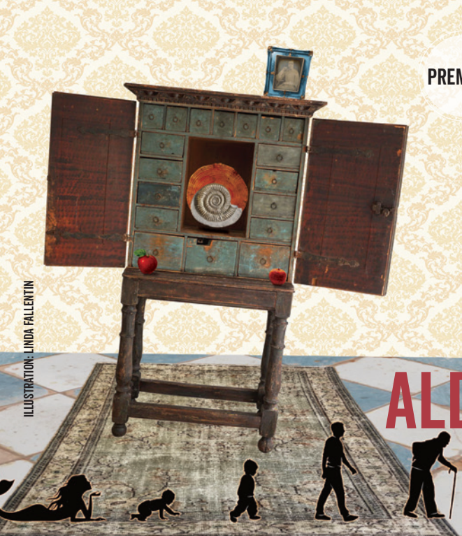
ILLUSTRATION: LINDA FALLENTIN